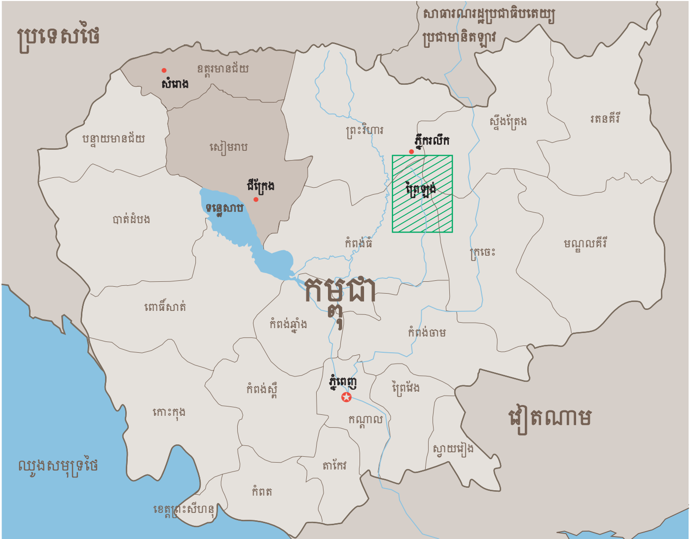
យកលំនាំតាមផែនទីអ.ស.ប លេខ 3860 rev. ចុះថ្ងៃទី៤ មករា ២០០៤