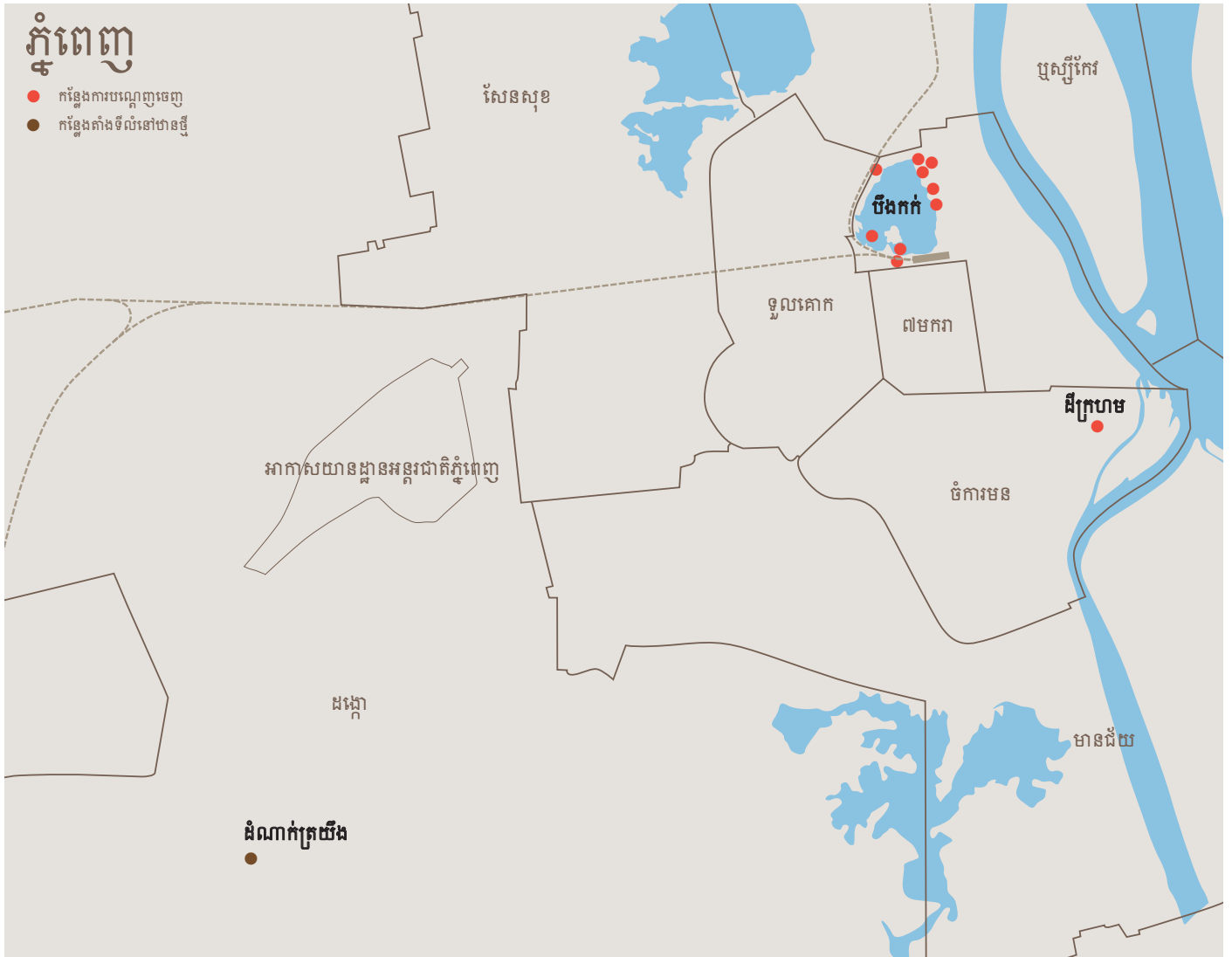
យកលំនាំតាមផែនទីអង្គការសមាគមធាងត្នោត